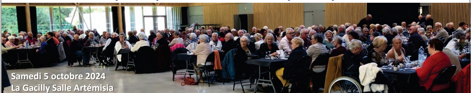
Samedi 5 octobre 2024 La Gacilly Salle Artémisia