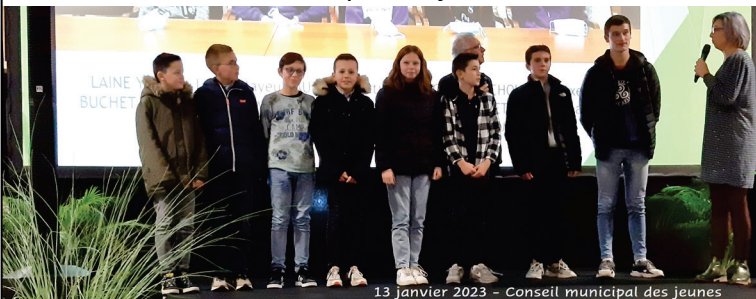
13 janvier 2023 - Conseil municipal des jeunes

Les grands projets présentés lors de cette soirée seront expliqués dans le prochain bulletin municipal. On retient donc ici quelques précisions nouvelles données pour 2023. Des boîtes à livres seront installées dans les 3 bourgs à l'initiative du conseil municipal des jeunes.